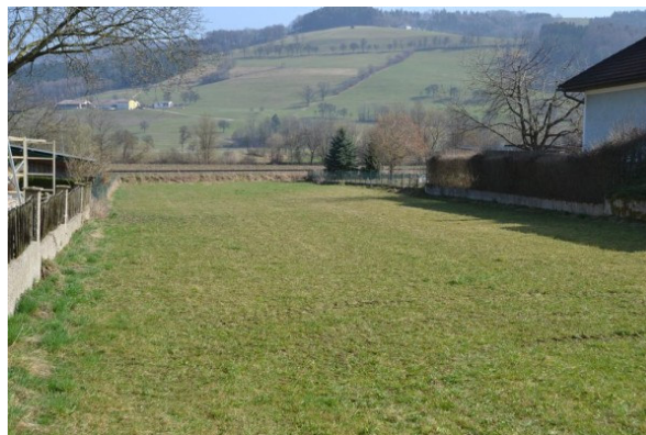
großer Garten möglich